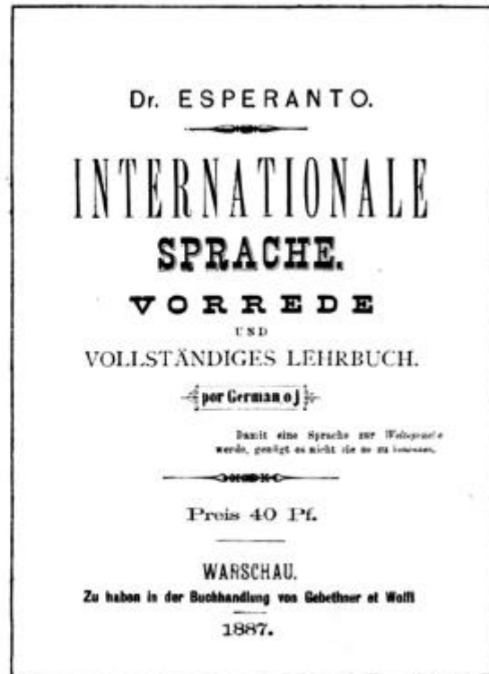
La unuaj lernolibroj de Esperanto: por Rusoj, Poloj, Francoj, Germanoj.