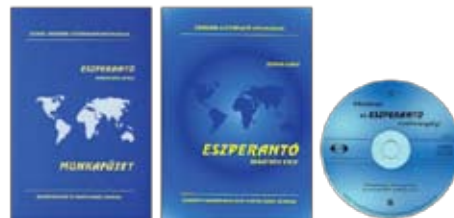
La instrupakaĵo “Sukcesu en la Esperanto-ekzameno!”, verkita de Szilvási László

Okazas, ke lastatempe foj-foje ni devas venki antaŭjuĝojn pri profitvoremeco. Ne ĉiuj esperantistoj povas distingi inter E-entreprenoj, kaj kelkfoje ni devas klarigi, ke ni ne melkas aliajn Esperanto-