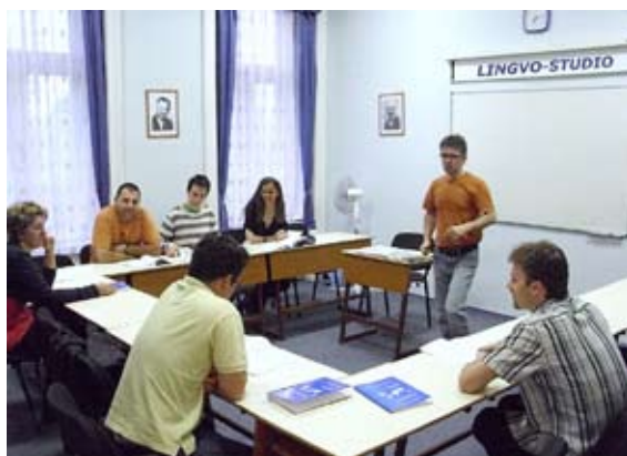
La 3-lernoĉambran Esperanto-Centro kaj Lernejo en Budapeŝto funkcias en 110 m 2 -a apartamento

Mi lernis Esperanton en mia mezlerneja aĝo, kaj multe aktivis en ĉiuj niveloj en la tradicia E-movado. Jam de 30 jaroj mi ĝuas unikan situacion: mia laboro egalas al mia hobbio, mi ne estas dungito, tutan tagon mi povas okupiĝi pri Esperanto, tio vivtenas min – do mi estas kontenta. Paroli pri ontaj planoj estas malfacile, ĉar preni novan taskon mi povus nur se mi liberiĝos de kelkaj ĝisnunaj. Ankaŭ tio povas okazi facile, ĉar la nuna speciala, favora situacio en Hungario povas finiĝi en iu ajn momento. Mi ŝatus trejni homojn, volonte mi transdonas miajn diversajn spertojn, kaj mi estas malferma alfronti ankaŭ novajn defiojn – se ili vekas mian scivolon :-)