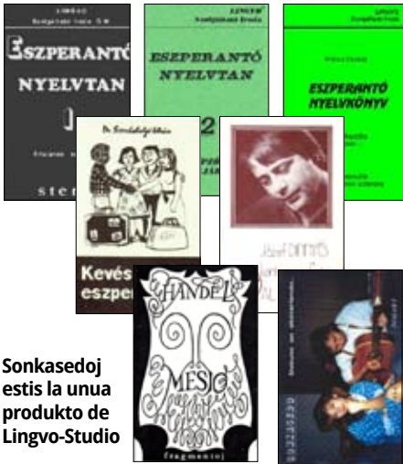
Sonkasedoj estis la unua produkto de Lingvo-Studio

instancoj, libroeldonejoj. Tiuj agadoj vivtenis nian entreprenon jam en tiu epoko, kiam ne ekzistis la nuna deviga lingvoekzamena sistemo en hungaraj universitatoj... Nuntempe nia ĉefa projekto estas funkciigo de aparta Esperanto-Lernejo en Budapeŝto, kaj krome, paralele, interreta E-kurso – en pagata formo! Ankaŭ ili estas iuspekaj rekordoj en Esperantujo.